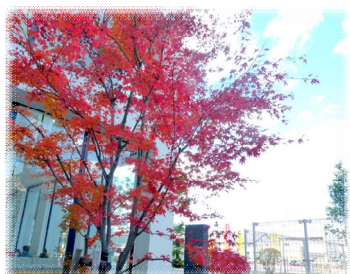
正面玄関横の紅葉

一方で我が国では、他国に例をみないスピードで超高齢化社会が進行しており、社会経済の変化とともに国民生活の向上や医療に対する国民のニーズはさらに多様化・高度化しており、医療機関にとって医療サービスの向上が求められております。当院はこういったニーズに臨機応変に対応できるよう、ハード面・ソフト面ともにより充実した医療を目指し、今年も職員一丸となって精進して参りたいと思います。終わりに、皆様の益々のご健勝とご多幸をお祈り申し上げます。