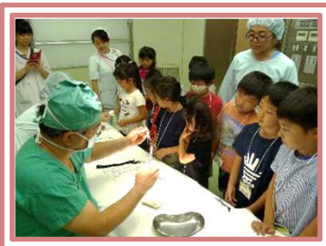
←手術室で人工皮膚を縫合しています

今年46名の子どもたちが病院見学会に参加しました。手術室や放射線科、薬剤部など各部署で院内見学を行いました。