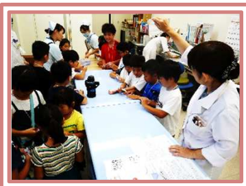
←薬剤部で調剤の勉強をしています