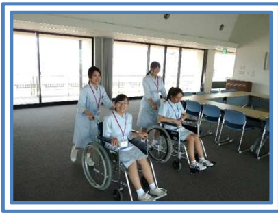
実際の医療現場を見学したり車イスでの移動を体験しました。

高校生の希望者を対象として、見学や簡単な看護体験、医療・看護関係者との交流を行いました。